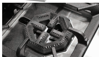
Quemadores de hierro fundido y de alta potencia