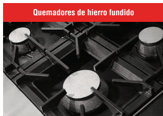
Quemadores de hierro fundido